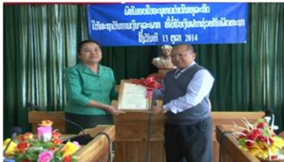
ພິທີມອບ ຮັບໃບສ້າງຕັ້ງ ຖາວອນ ສກຈບ ຊ່ວຍກັນພັດທະນາ

ສກຈບ ຊ່ວຍກັນພັດທະນາ ທີ່ຂຶ້ນກັບສະຫະພັນແມ່ຍິງ ແຂວງ ໄດ້ຮັບການສ້າງຕັ້ງຊ່ວຍຄວາມຂຶ້ນໃນວັນທີ 1 ມິຖຸນາ 2009. ຫຼັງຈາກທີ່ສະຖາບັນໄດ້ຖອກທຶນຄົບໃນ ເດືອນ ກັນຍາ ປີ 2014, ສາມເດືອນ ຕໍ່ມາກໍ່ໄດ້ຮັບໃບອະນຸຍາດ ຖາວອນ. ມາເຖິງວັນທີ 13 ຕຸລາ 2014 ສະຖາບັນກໍ່ໄດ້ຈັດ ພິທີມອບໃບອະນຸຍາດດຳເນີນທຸລະກິດຂຶ້ນ, ຢູ່ທີ່ຫ້ອງຫໍ ວັດທະນາທຳແຂວງ ໂດຍໃຫ້ກຽດເປັນປະທານຂອງທ່ານ ສາຍສະໜອນ ກິບເກສອນ ຮອງຫົວໜ້າທະນາຄານແຫ່ງ ສປປ ລາວ ພາກເໜືອແຂວງຫຼວງພະບາງ ແລະ ທ່ານ ນາງ ລ້ອງຄຳ ພອນມິໄຊ ປະທານສະຫະພັນແມ່ຍິງແຂວງ, ປະທານສະພາບໍລິຫານ ສະຖາບັນການເງິນຈຸລະພາກທີ່ບໍ່ ຮັບເງິນຝາກ ຊ່ວຍກັນພັດທະນາ.