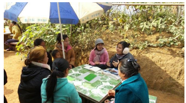
ການສຳພາດ ລູກຄ້າຂອງ ສມກາຈ ໄຊນິຍົມ ໃນລະຫວ່າງການກວດສອບຜົນການ ປະຕິບັດງານດ້ານສັງຄົມ ໃນເດືອນທັນວາ ປີ 2014 ທີ່ ແຂວງອຸດົມໄຊ