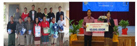
ສກຈບ ພັດທະນາອຸດົມໄຊອຸປະຖຳງານຕ່າງໆ ທາງດ້ານສັງຄົມທີ່ແຂວງ ອຸດົມໄຊ ລວມມູນຄ່າ 60 ລ້ານ ກີບ.

ພ້ອມນີ້ ສກຈບ ພັດທະນາອຸດົມໄຊ ໄດ້ຈັບລາງວັນຄືນກຳ ໄລໃຫ້ລູກຄ້າໃນແຕ່ລະບ້ານເປົ້າໝາຍ ເພື່ອຄືນກຳໄລໃຫ້ ແກ່ລູກຄ້າ ໃນບ້ານ ທີ່ສະຖາບັນ ໃຫ້ບໍລິຫານ.