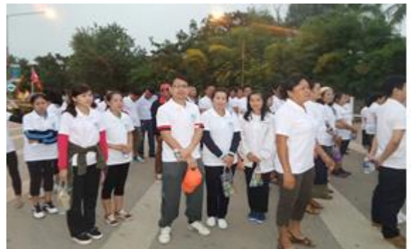
ພະນັກງານ ສກຈຈ ຈຳປາລາວ ເຂົ້າຮ່ວມງານຢ່າງ ເພື່ອສະເຫຼີມສະຫຼອງ ການດ້ານວັນໃຊ້ແຮງງານຕໍ່ກັບຜູ້ຍິງ ແລະ ເດັກນ້ອຍ

ໃນປີ 2014 ທີ່ຜ່ານມາ, ສກຈຈ ຈຳປາລາວ ໄດ້ປະກອບ ສ່ວນທາງດ້ານສັງຄົມຫຼາຍກິດຈະກຳ ເຊັ່ນ: ອຸປະ ຖຳ ເຮືອ ຊ່ວງ 2 ຄັ້ງ, ປະກອບສ່ວນສະໜັບສະໜູນ ອຸປະກອນ ການ ສຶກສາ ໃນ 4 ໂຮງຮຽນ ເຂດຊົນນະບົດ ໃນແຂວງ ຫລວງພະບາງ, ສະໜັບສະໜູນ ງານປະເພນີ ໃນ 6 ໝູ່ ບ້ານ, ຄືນກຳໄລ ເປັນລາງວັນໃຫ້ລູກຄ້າທີ່ດີເດັ່ນ ແລະ ແຈກລາງວັນ ໃຫ້ລູກຄ້າຫ້າວຫັນ ລວມມູນຄ່າທັງໝົດ 72 ລ້ານ ກີບ.